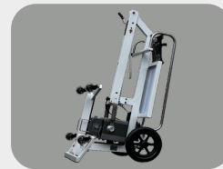
Plegado y en posición vertical